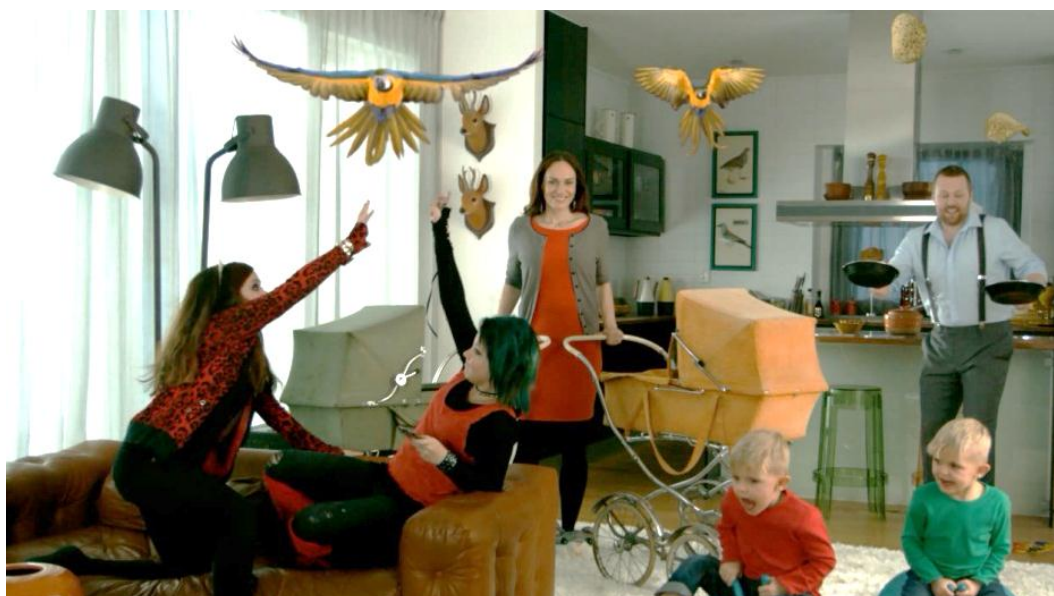
Kuvakaappaus Asuntomessujen TV- mainoksesta, jossa tuotiin perhettä esille.

Markkinoinnin- ja markkinointiviestinnän osalta Asuntomessujen yhteistyökumppani- na oli mainostoimisto TBWA Helsinki. Tapahtumamainonnan konseptina oli ”UNEL- MAKOTEJA & KOTIUNELMIA”, jossa pääpaino oli oikeiden perheiden unelmakotien ja kotiunelmien esittelyssä.