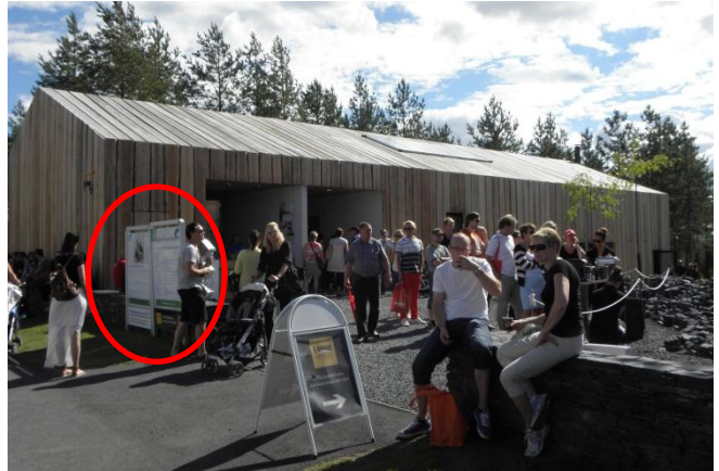
Perhekuva kohteesta "Maja", kuva näkyi mm. perhetaulussa kohteen edustalla.