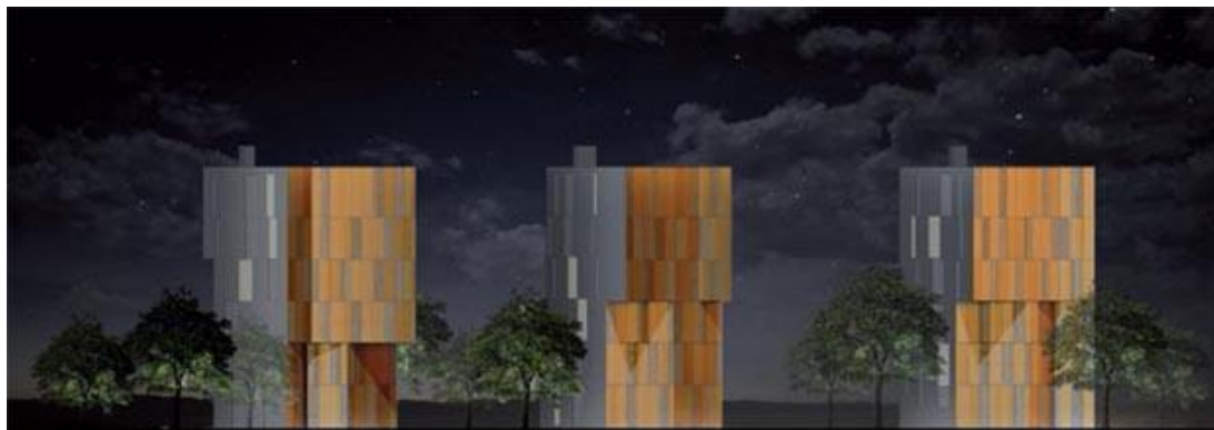
Yksi tornitaloista, "Jyväskylän Maailmanpylväs", esitellään Asuntomessuilla Jyväskylässä.

YIT Rakennus Oy ja Jyväskylän kaupunki järjestivät Jyväskylän asuntomessualueelle arkkitehtuurikilpailun, jonka tavoitteena oli löytää Jyväskylän Äijälänrannan kolmen 12-kerroksisen tornitalon suunnitelma ja yksi tornitaloista valmistuu kesän 2014 messuja varten. Kilpailu järjestettiin yleisenä arkkitehtuurikilpailuna ja siihen osallistui 33 ehdotusta. Messuilla 2014 tullaan esittelemään arkkitehtuurikilpailun voittajaehdotuksen mukaisesta tornitalosta 5 kpl kerrostalohuoneistoja.